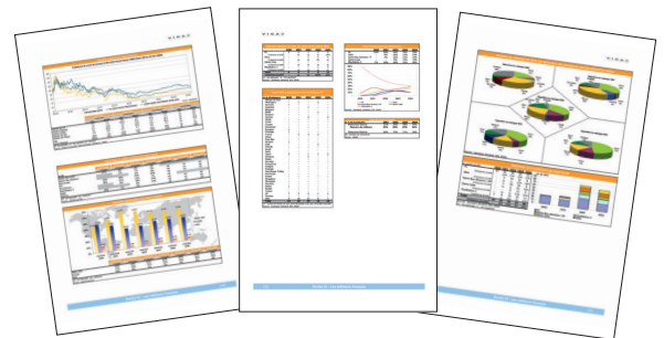
Un portrait détaillé des plus grands éditeurs mondiaux et de leur politique de production et de sous-traitance, par support, par genre... Une analyse financière et stratégique des studios indépendants français.

☛ Sommaire complet (14 pages) disponible sur www.mass-media.fr/guide/vigao.htm